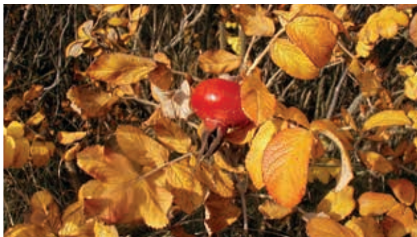
Modne hyben på rynket rose.

Rynket rose er blevet næsten altdominerende. >