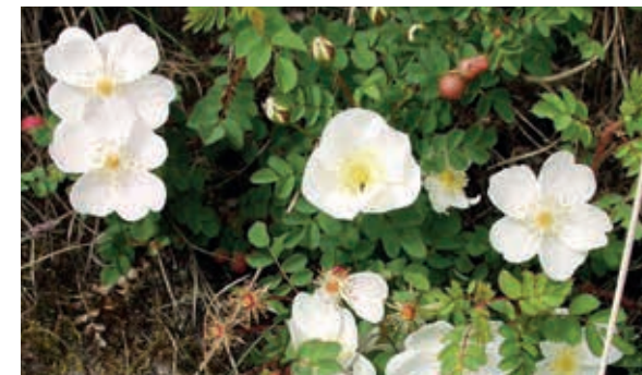
Klitrosen hører til i den danske natur og får sorte hyben.