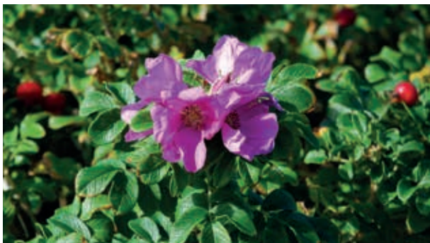
Rynket rose i blomst.